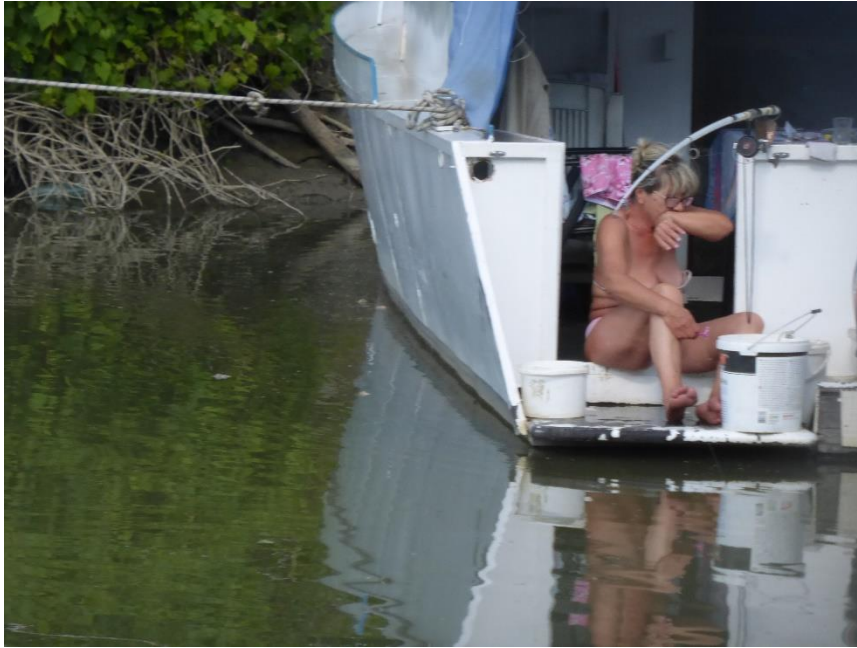
Банатска обала: чишћење улова (без зума и са зумом).