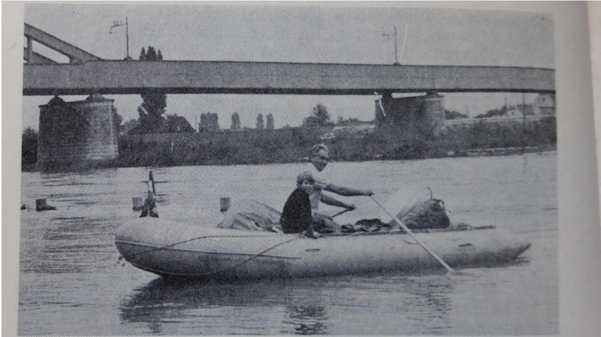
Pneumatički čamac »ZONI« za vreme cirkumnavigacije Balkana između dva mosta na Savi kod Zagreba. Deca su najbolji mornari

koje mogu potpuno bezbedno da se smesti i 20 osoba i po naj- brevetiranom vremenu. Potražnja je toliko porasla da