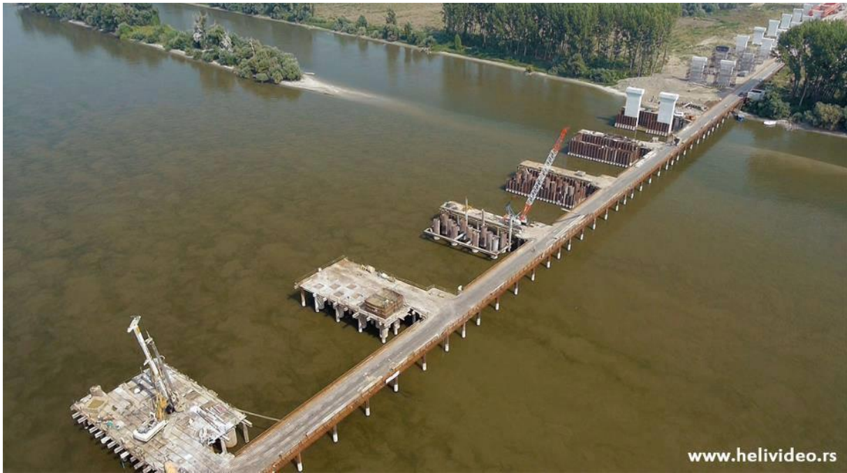
Мост у време изградње. На Бељарици Доњој леп пешчани спруд и миран рукавац – наш циљ.

Неко из групе је дао предлог да идемо да видимо садашње стање, и шта је остало од 2 Бељарице пошто су грађевинари рашчистили своју помоћну мостовску конструкцију. Иако је водостај и Дунава и Саве ових дана у опадању, кренули смо храбро у авантуру, јер брод 'Истар' плови малим газом, а и опремљен је електронским навигационим уређајима, и то још са екранима у колору.